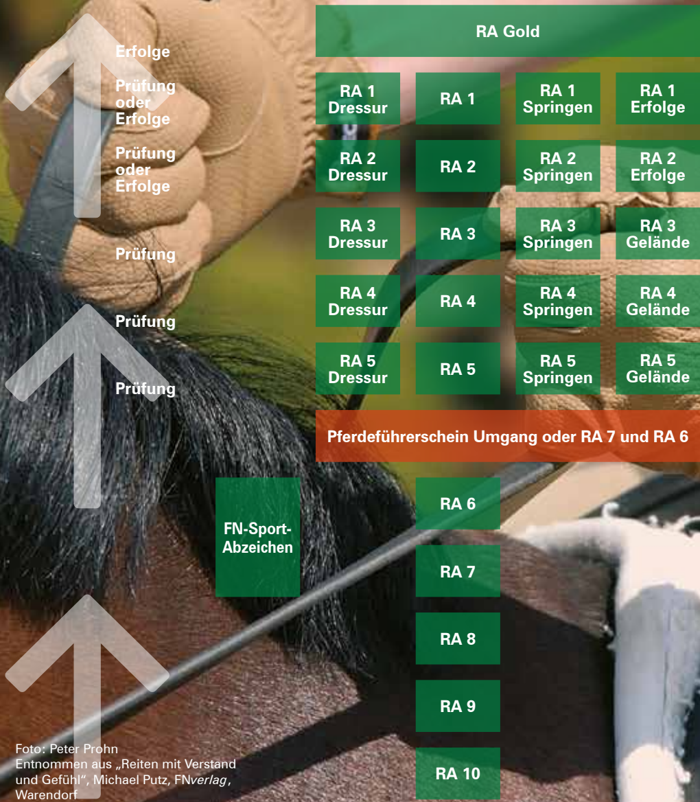
Foto: Peter Prohn Entnommen aus „Reiten mit Verstand und Gefühl“, Michael Putz, FNverlag, Warendorf